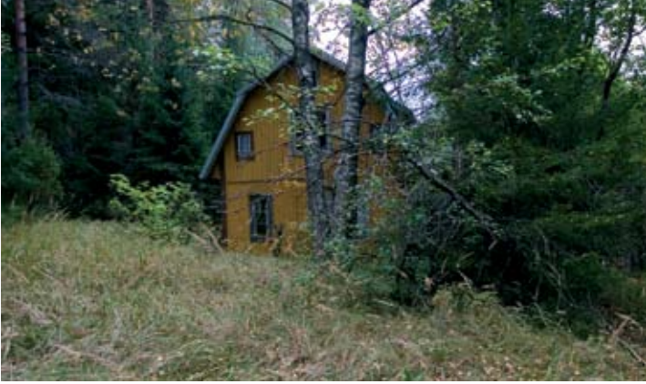
Yli-Myllyn päärakennus vuonna 2008.