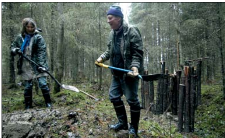
Padon rakentajia Harjussa marraskuussa 2007. Padon rakentamisessa käytetty puutavara on tuotu suojelualueen ulkopuolelta.