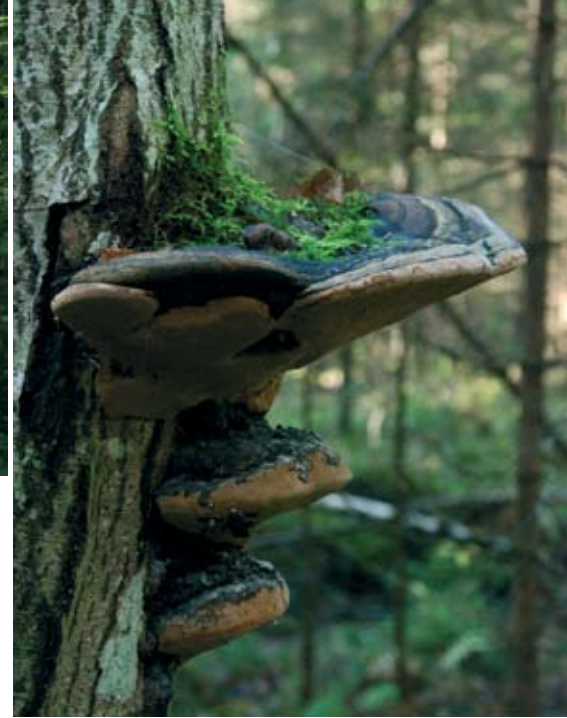
Pähkinäpensaistoa ja arinakääpä Limbergissä.

teesta – Natura-ohjelmaan kuuluva 14 hehtaarin Pytbergin metsäalue, mikä vielä nostaa alueen arvoa.