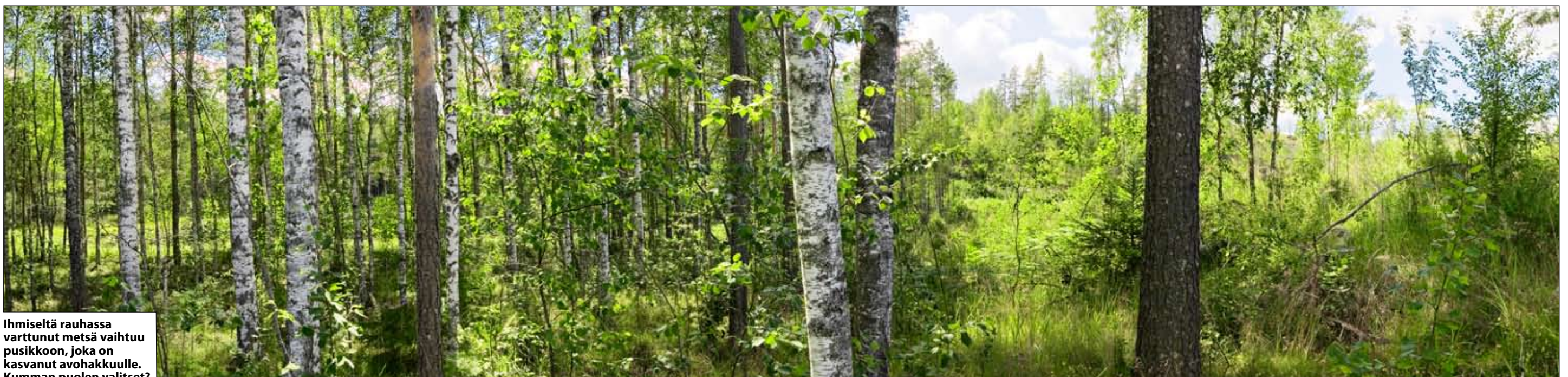
Ihmislähtöisessä varttunut metsä vaihtuu pusikkoon, joka on kasvanut avohakkuulle. Kumman puolen valitset?

Mitä siitä tuumaisi emokarhu poikineen tahi valkoselkätikka? Nekin on näillä main nähty.