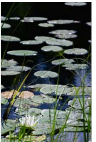
Lumme kukkii Keltalammella, jonka vesi on soisen tummaa.

Metsässä ei sotien jälkeen ole tehty mitään metsänhoidollisia toimia. Valtio antoi rauhan tultua palstan evakkojen joutuneelle karjalaisperheelle, joka asuttettiin Heinolan seutuville. Metsä oli sen verran kaukana muista tiluksista, että se